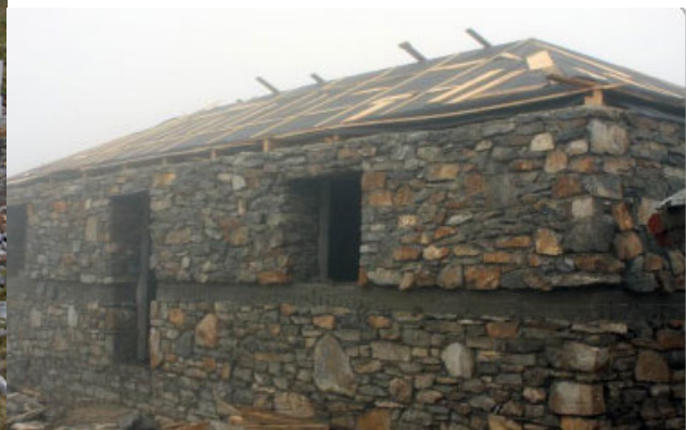
Εικόνα 1: